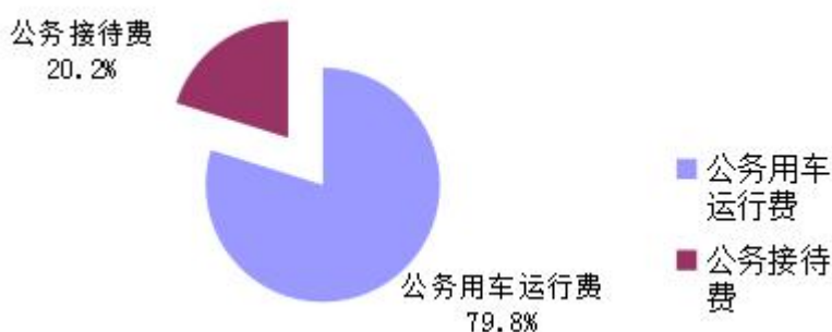
中国人民银行原辽阳市中心支行 2022 年度“三公”经费支出构成

2022 年度“三公”经费决算数 7.03 万元，公务用车运行费 5.61 万元，占 79.8%；公务接待费 1.42 万元，占 20.2%。具体情况如下：